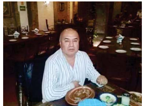
HASTA pronto amigo.

de la ciudad, el recorrido dará inicio en el parque del Ahuehuate a partir de las 10 hrs. Cabe destacar que todos los danzantes serán atendidos con desayuno y comida, en lo que hoy se llama centro de convenciones, en el ex convento del Carmen, si usted, amable lector, es amante de las tradiciones de danza y color, asista al convite el 26 de agosto y presencie el Atlixcayotontli el domingo 2 de septiembre, lleve a sus niños para que disfruten de esta fiesta, pero además, contribuya con su presencia, el año pasado llegaron 4 mil asistentes y las organizadoras este año esperan a 5 mil visitantes. No se pierda esta bonita fiesta.