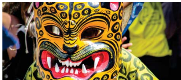
CELEBRACIÓN del Día del Tecuán en la Mixteca pobлана

El Día del Tecuán tuvo una duración de cuatro días de actividades consecutivas, realizadas en el centro de Acatlán, donde