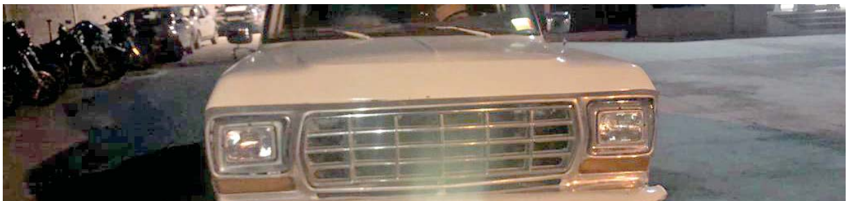
TRANSPORTABA mil 200 litros de combustible de procedencia ilícita

Al notar la presencia de la policía, los huachicoleros realizaron detonaciones con arma de fuego, dándose a