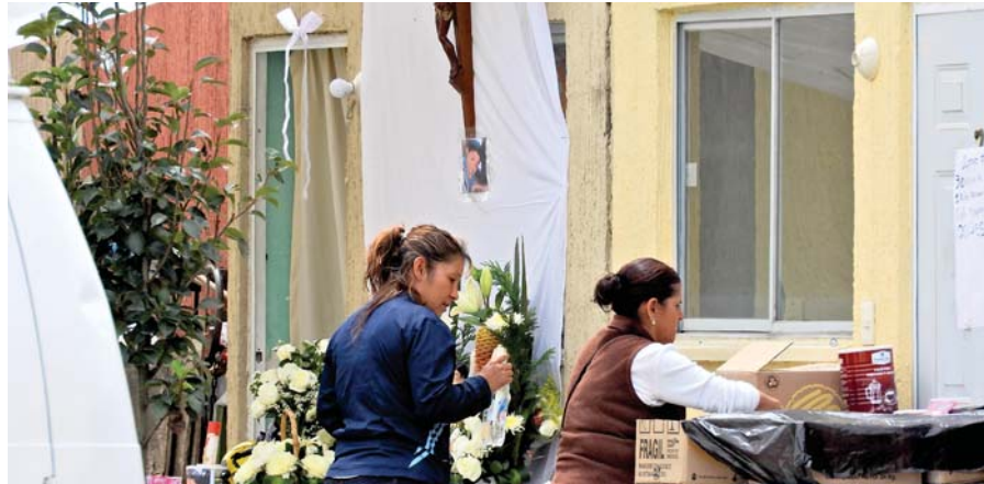
LA FAMILIA sigue en espera del cuerpo del pequeño para despedirlo