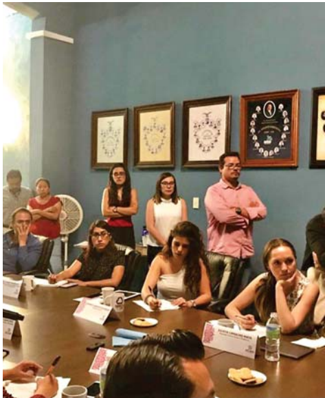
REGIDORAS dejan pasar oportunidad

E stimados lectores de Puntual, a partir de éste número del semanario que tiene en sus manos, iniciamos con la columna Las Tres de Atlixco.