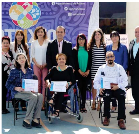
HOMENAJE a destacadas atlixquenses

Ahora tendrá que pasar a la galería de presidentes municipales de nuestro querido Atlixco Pueblo Mágico.