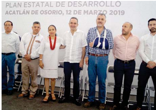
AUTORIDADES estatales ponen en marcha el Foro de Participación Ciudadana

La colaboración entre el gobierno y los ciudadanos permitirá un cambio en la aplicación de los recursos y la implementación de políticas públicas, debido a que se prevé que el Plan Estatal de Desarrollo (PED) incluya